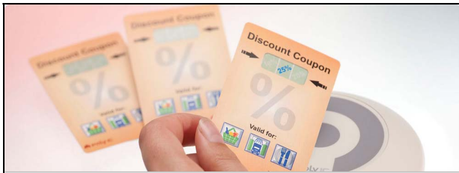
3. ábra A kártya kijelzőjén aktiválás után megjelenő színes jel mutatja a korábban nem ismert árengedmény mértékét vagy a nyeremény elismerését

berendezés hatókörébe kell tartania. Ez az információ lehet pl. egy rendezvény belépőkártyájának érvényessége vagy egy termék valóságának igazolása. A PolyLogo-RAD kártya kitűnő marketingeszköz. A 3. ábrán látható aktivált kártya pl. azt mutatja, hogy egy vásárló – aki a kártyához egy folyóirat mellékleteként jutott hozzá – jogos valamilyen áru árengedményére, amelynek mértéke csak az üzletben derül ki. Hasonló kártyákat nyeremény ígéretével is terjesztenek. Az ajándéknak szánt kártyákon az ajándékozó által előre kifizetett elkölthető összeg jelenik meg. Egy vállalat PolyLogo-RAD kártyák formájában kiállítási vagy bemutatóira érvényesíthető belépőt küldhet ügyfeleinek. Ezek csupán a kezdeti alkalmazások. A fejlesztők azt remélik, hogy a jövőben számos, ma még elképzelhetetlen új területeken jelennek meg ezek az okos és egyre okosabb kártyák.