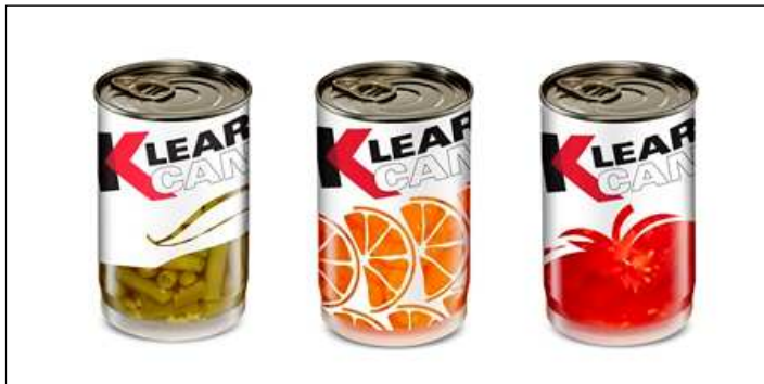
2. ábra A Milacron cég átlátszó falú, alumíniumfedelű Klear Can márkanévű dobozai

Kicsit bonyolultabb a Milacron cég (Batavia, Ohio) átlátszó falú, háromrétegű (PP/EVOH/PP) fröccsöntött doboza (2. ábra, márkanéve Klear Can ), amelyen a fém-