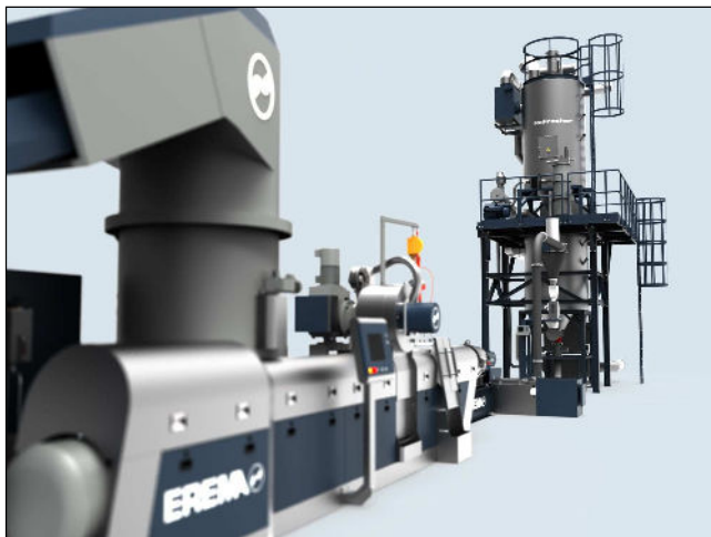
3. ábra Az Erema TVEplus extrudere (balra) és a Refresher (jobbra)

Erre végzett kutatások szerint egy érzékeny emberi orr milliárdnyi szagot képes megkülönböztetni. A hulladékban előforduló faalapú szennyeződés (cellulóz, papírcímke), a szilikon alapú adalékok, a nyomtatófestékek; az élelmiszermaradékok, az olajok és zsírok az extruderben a hő hatására kémiai változást szenvedhetnek és ezáltal is „szagosítják” a regranulátumot. Az utóbbiak eltávolítására a regranulálás után külön