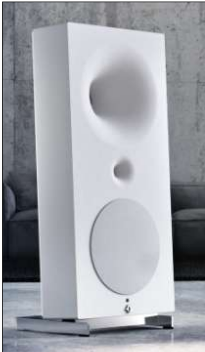
2. ábra Rangos díjat nyert PUR hangfaldoboz

Poliuretánból fröccsöntött hangfalpár nyerte a European High-End Audio Solution 2014-2015 Best Product EISA díjat. A német Avantgarde Acoustic cég kiváló hangtechnikai minőségű Zero 1 aktív hangszórója nemcsak a tökéletes audioteknikával vívta ki a szakma elismerését, hanem a kellemes külsejű, teljesen sima műanyag ház is nagy sikert aratott (2. ábra). A díjazott hangszóró előlapja és valamennyi oldala a Thieme GmbH & Co (Teiningen, Németország) poliuretánjából RIM eljárással előállított formadarab. A hátlapon elhelyezkedő hangszóró elemeket, valamint az elektronika borítólapját szintén poliuretánhabból fröccsöntötték.