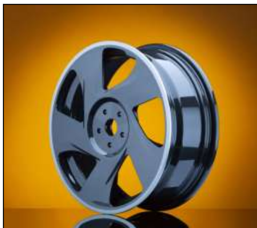
1. ábra Ultrakönnyű kerékbroncs Ultem kompozitból

A svájci Kringlan Composites, a Sabic ((Saudi Basic Industries Corporation) és a felhasználásban érdekelt ipari partnerek a világon elsőként termoplasztikus kompozitból kerékbroncsot (1. ábra) fejlesztettek ki. A kerék alapanyaga a Sabic cég Ultem márka-névű poliéterimidje (PEI) szénzállal erősítve. Más hőre lágyuló műanyagokkal összehasonlítva a fejlesztők azt állítják, hogy a PEI kompozit kitűnik a magas hőmérsékleten is nagy szilárdságával és kiváló vegyszerállóságával. Az új technológiával gyártott kerék alkalmazásánál egy meg nem nevezett német autógyárral kooperáltak. A kompozitkerék szerelhető hagyományos fémküllőkkel vagy szénzállal erősített kompozitból készültekkel is. Az autóiiparból máris több első vonalbeli beszállító (OEM) érdeklődik az új kompozitkerékek iránt, amelyek alkalmazása a személygépkocsik CO 2 kibocsátását 2–3%-kal csökkenti. A fejlesztők szerint más iparágakban is előnyös lehet a műanyagkompozit kerék alkalmazása, példaként a mosógép motorját említették.