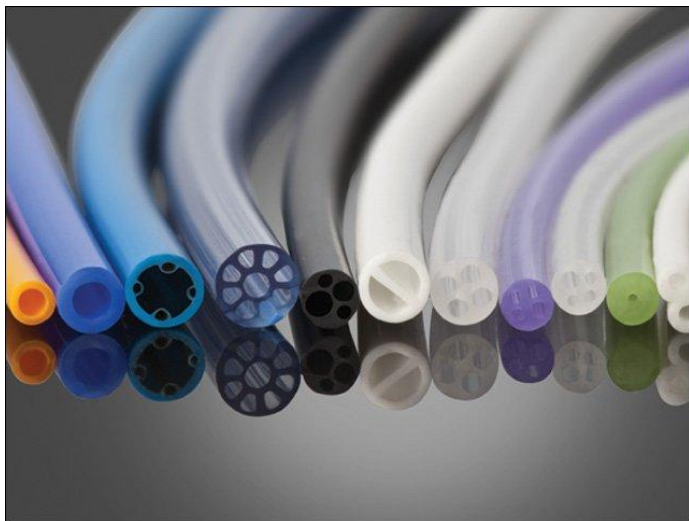
5. ábra Változatok a katétercsövekre

A perisztaltikus szivattyúk csövei lágyak, összenyomás után rugalmasan visszaalakulnak eredeti méreteikre, ellenállnak a koptatásnak és a dinamikus igénybevételnek, anyagukból csak nagyon kevés anyag oldható ki. Katéterekhez viszonylag kemény elasztomerre van szükség, a csövek felületének simaságára ügyelni kell és mikroorganizmusok sem szaporodhatnak rajtuk. Emellett valamennyi orvosi csőre vonatkoznak a következő igények: gyártásuk legyen egyszerű és termelékeny, továbbá legyenek biokompatibilisek, sterilizálhatóak és hegeszthetőek vagy más módon összeépíthetőek más anyagokkal. Az orvosi csövek gyártásakor a megfelelő alapanyagok kiválasztása és a megfelelő forma tervezése a legfontosabb feladat.