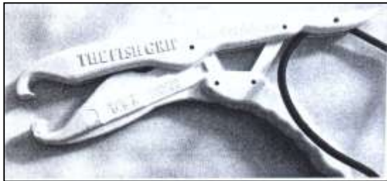
3. ábra Halkiemelő fogó

A megoldást az jelentette, hogy az alapanyagot lecserélték egy olyan polipropilénre, amely 20% cellulózt tartalmaz ( Thrive M a Weyerhaeuser cégtől). Emellett a leggyengébb résznél erősítő bordát alkalmaztak, illetve néhány éles saroknál megnövelték a lekerekítéseket. Az új fröccsparaméterek és az alapanyagok rugalmassági modulusát a 4. táblázat szemlélteti. A feltüntetett változtatások révén a funkcionális probléma megszűnt, és a ciklusidő jelentősen csökkent.