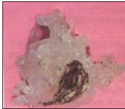
4. ábra Az etető eltömődését okozó szilárd műanyag labda

Egy speciális fröccsöntési probléma, ha a csigahenger etetőnyílása eltömődik. Ebben az esetben az első lépés, hogy a gépet leállítsák és megállapítsák, mi okozta a jelenséget, hogy megismétlődését a jövőben elkerüljék.