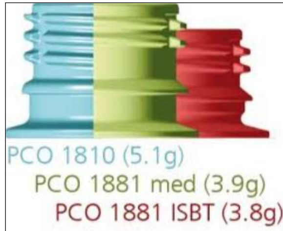
3. ábra A nyak és a menet rövidítésével 1,3-g-mal csökkent a palackzáráshoz szükséges kupak tömege

jutott el a jelenleg is legnagyobb mennyiségben alkalmazott PCO 1810-es zárórendszerrel a PCO 1881-ig. A 3. ábrán látható, hogy ennek következtében a palackok menetes része és a menetnek a hossza fokozatosan rövidült, emiatt a PCO 1881-es kupak tömege 1,3 g-mal kisebb, mint a PCO 1810-é. A kutatók dolgoznak a további tömegcsökkentésen. Az 1. táblázat a svájci Schöttli cég egy 30/25-ös standard kupak 5 éves fejlesztésének köszönhető eredményeket mutatja be.