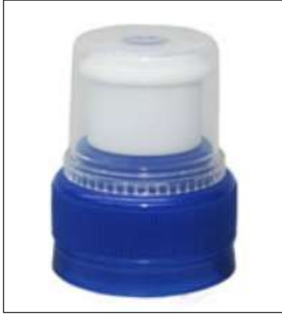
1. ábra A Corvaglia/-Ferromatic cég sportkupakja

az ún. „porvédő”. Ennek a kupaknak a népszerűsége egyre nő és nemcsak sportolók, hanem pl. utazók is szívesen használják az ilyen kupakkal ellátott palackokat. Az bonyolult kupakokat etázsszerszámokban, esetleg elfordulásra képes etázsszerszámokban gyártják.