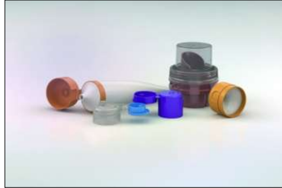
2. ábra A Menshen cég bepattanó fedéllel záródó tubuskupakja és néhány más új terméke

Mivel ma a csomagolásnak egyik nem elhanyagolható funkciója, hogy magára vonja a vásárló figyelmét, ezt a kupaktól is elvárják. Ezért nem ritkán az alapfunkciót jelentő zárórész egyszerű menetes henger, amelyet egy többszörösen nagyobb átmérőjű, a dizájnos palackhoz illő, vonzó külsejű burkolatban rejtettek el. Ilyeneket többnyire a kozmetikai anyagokhoz alkalmaznak.