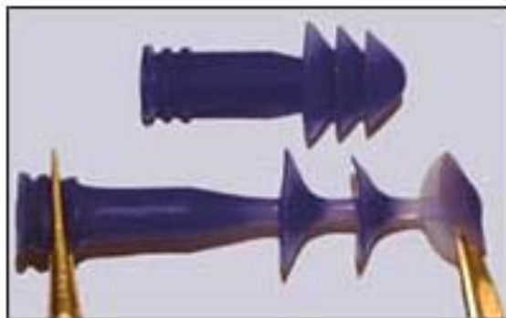
4. ábra A KE2004-20-as típusból fröccsöntött fül dugók jól bírják a szerszámból való kivétel okozta igénybevételt

A Shin-Etsu cég négy új LSR típust dobott piacra, az 5–20 Shore A tartományban. Ezek jobb fogást biztosítanak az emberi kéznek a különböző felhasználási területeken, ugyanakkor megfelelő szilárdsággal bírnak, a lágyság ellenére. Kidolgoztak még új, magas hőállóságú, de alacsony illóanyag-kibocsátású, önkenő típusokat is autóiipari felhasználásra.