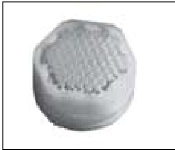
1. ábra 2K fröccsöntéssel készített szűrő vízcsapokhoz: szűrőbetét PA66-ból, ráfröccsöntött tömítőréssz LSR-ből. Fröccsgép: horizontális elrendezésű Engel

megetakarítás az eredmény. Ugyanakkor 50%-kal csökkenthető a termék keménysége, ezzel jelentősen javítható az adott termék „fogása”. A habosítatlan LSR sűrűsége 1,1 \text{ g/cm}^3 , a habosítotté 0,45 \text{ g/cm}^3 -ig csökkenthető. Az alkalmazott gáznyomás 100–200 bar, az LSR mindkét komponensébe belevezetik a gázt szuperkritikus állapotban. A komponenseket sztatikus keverőben elegyítik, ez 2–3-szor hatékonyabb, mint pl. egy fröccshengerben végzett keverés kémiai habosítószerrel, és a nyíró-igénybevétel is kisebb. A fröccshenger zárófűvökával van ellátva, így megakadályozható a rendellenes habosodás.