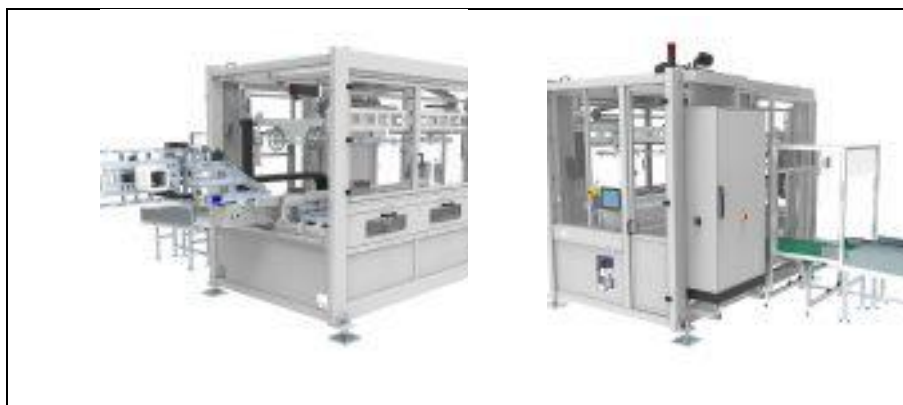
3. ábra Az új gyártórendszer elülső oldala (balra) és a kivétel oldala a futószalaggal (jobbra)

A Beck Automation AG (Oberengstringen, Svájc) a 2018-as friedrichshafeni Fakuma kiállításon mutatta be Basic IML márkanevű fröccsöntő rendszerének legújabb tagját, amellyel egy vagy kétfészkes szerszámban is lehet 1 és 5 liter közötti űrtartalmú, szerszámban címkézett (IML) vödröket gyártani. Ez a gép a korábban kifejlesztett, 5–33 literes, egyfészkes gyártórendszer újabb változata.