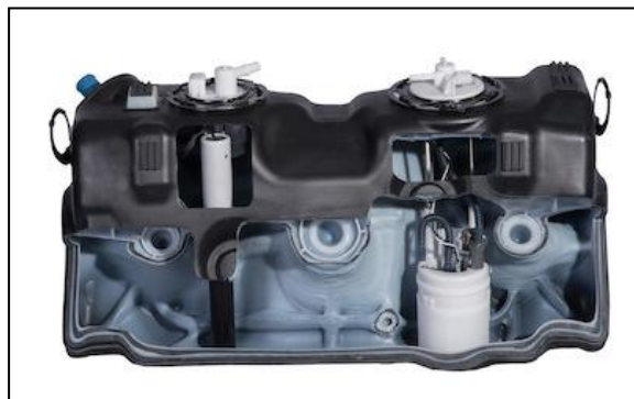
2. ábra Az elektromos autók hatótávjának megnövelését lehetővé tevő műanyag üzemanyagtartály kivágott oldalfallal

A TAPT eljárás egy olyan flexibilis gyártási módszer, amely lehetővé teszi egyetlen fúvószerszám alkalmazásával többféle üzemanyagtartály elkészítését az összes típusú, vagyis dízel, benzin, vegyes üzemanyagú, részben zéró kibocsátású jármű (PZEV) és hibrid, hajtáslánc számára. Jelenleg az autógyártók különféle kialakítású üzemanyagtartályokat vásárolnak az üzemanyag típusa és a regionális eltérések szerint. A TAPT eljárás lehetővé teszi a komplett jármű platformok globális egységesítését.