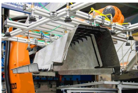
5. ábra A Leika projekt kutatóinak acélból, magnéziumból és szénszállal erősített műanyagból hibrid technológiával kialakított akkumulátorlagútja

Az üvegszálas műanyagokat is tartalmazó könnyűszerkezetes építőelemek gyártási költségei erősen függenek a félkész termékek árától. Ezeket a költségeket lényegesen csökkenti az FDC ( Faser-Direkt-Compoundierung ) eljárás, amelyhez a gyártóberendezést az Arburg