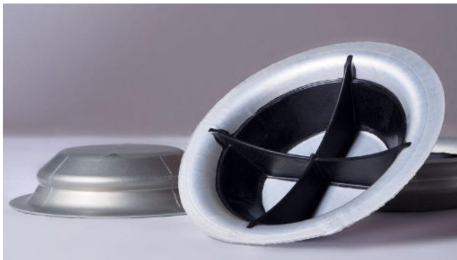
1. ábra A TU Chemnitz mélyhúzással gyártott hibrid formadarabja

A Chemnitzi Műszaki Egyetemen (TU Chemnitz) kétlépcsős eljárásban kombináltak fémét műanyaggal. Fémlemezről mélyhúzással egy lapos tál alakú előformát készítettek, majd ugyanabban a szerszámban a szerszám dugattyúján keresztül egy második lépésben nagy nyomással műanyag bordákat fröccsöntöttek rá. A nyomás hatására a tálka tovább formálódott, és a műanyag elem hátrametszéssel összeépült a fémmel (1. ábra). A aacheni