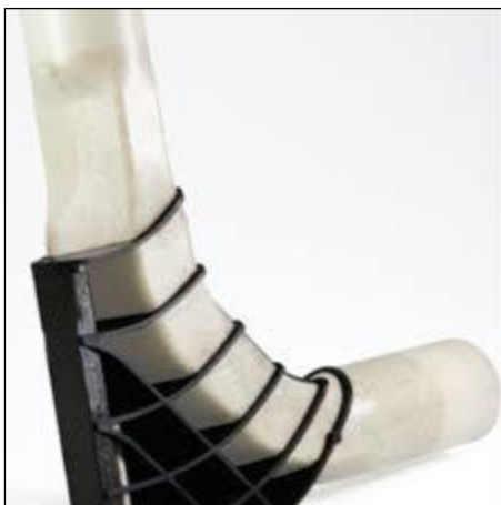
6. ábra A Fu-Pro projekt keretében előállított erősítő

Az ILK kezdeti eljárását a Fu-Pro projekt keretében kívánják továbbfejleszteni. A Brose Fahrzeugteile GmbH (Coburg) vezetésével – amely ugyancsak jelen van Magyarországon a kecskeméti Brose Hungarian Automotive Kft. révén – erre egy konzorciumot alapítottak. Egy olyan építőelem-rendszert fejlesztettek ki, amely sík lapokból áll, de torzióknak és hajlításnak ellenálló üreges profilokkal, továbbá hurkolt bordás kötésekkel erősítették meg kívülről. A kutatók új megoldásokat találtak ki az automatizált előformázásra, konszolidálásra és funkcionálisra. Az eljárásban hibrid szálakból font tömlőkből variometer fűtéssel működő szerszámban készítették el az üreges profilt, majd egy újabb lépésben a fröccsöntő szerszámban fémbetét, szerves bádogból kivágott betét behelyezése után ráfröccsöntötték a hőre lágyuló műanyagot. Egy ilyen erősítő elem a 6. ábrán látható.