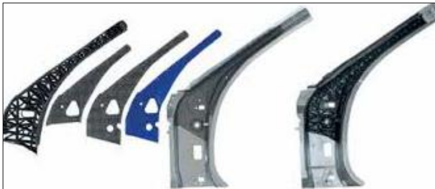
3. ábra A Forel Platform Q-Pro projekt keretében 3D hibridtechnikával kifejlesztett A-oszlop demonstrációs szerkezete. Az összetevő elemek balról jobbra: 1 fröccsöntött elem erősítőbordákkal, 2, 3 „szerves bádóg”-ból készített elemek, 4 (kék) tapadásnövelő elem, 5 a sötétszürke rész hőformázott, a világos rész hidegen formázott acéllemez, 6 (jobbra) az összeszerelt A-oszlop

A szállal erősített műanyagok és a hagyományos szerkezeti anyagok, elsősorban a fémekkel kialakított bonthatatlan kötéseket új tágas alkalmazási területeket nyitnának meg ezeknek az anyagoknak és a belőlük kialakított társított szerkezeteknek, ahol mindkét anyagfajta előnyei érvényesülhetnek. Ha az elemek összeszerelésének, összeépítésének munkája beilleszthető volna az automatizált gyártási folyamatba, a jobb reprodukálhatóság jelentősen növelné a gyártmányok minőségét is.