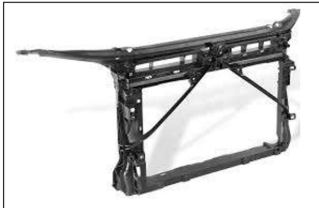
1. ábra A Skoda Octavia elülső részének üvegszálás PA-ból készített tartóváza

A Faurencia Kunststoffe Automobilsysteme GmbH (Ingolstadt, Németország) a Skoda autógyár új Octavia modelljéhez 60% üvegszálat tartalmazó PA6-ból, a Lanxess AG (Leverkusen, Németország) Durethan DP BKV 60 H2.0 EF kompaundjából készítette a gépkocsi elülső részének tartóelemét (1. ábra). A kevés számú más műanyag tartóelemmel ellentétben erre az elemre a sárvédőket is fel lehet szerelni. Megfelelő merevségüket a szerkezet felső részén látható kereszttrúd adja, amelyben semmiféle erősítő fémbetét nincs. Ez a kiválasztott „hightech” poliamid rendkívüli merevségének és szilárdságának köszönhető. A karcsú és vékony falú szerkezetet egyetlen szerszámban és darabban fröccsöntéssel állítják elő. A tartóelemre a hűtő helyénél és a motorfedél zárja körül különösen nagy erők hatnak. Ezt a kondicionált állapotban szobahőmérsékleten 13\ 100\ \text{MPa} rugalmassági modulusú PA 6 tudja viselni.