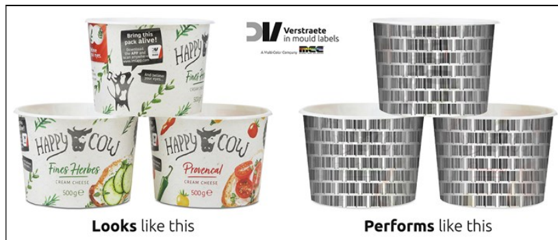
2. ábra A digitális vízjel megjelenése (jobboldali kép) a szabad szemmel is látható címke (baloldali kép) „mögött”.

A kód előhívása, aktiválása az amerikai Digimarc szoftverével történik okos telefonnal, vonalkód olvasóval vagy szkennelvel. A szoftver állítja elő a szétszórt pixelekből a kódot, majd összeköti az online adatbázissal, amelyben a leolvasott kódhoz egy sor információ adható meg a termék eredetéről, tulajdonságairól, alkalmazására vagy éppen a reciklálásra vonatkozóan. A digitális vízjel tartalmú címkét fel lehet vinni a tárgy felületére zsugorcímkéként, vagy a szerszámba helyezve in-mold label (IML) címkéként, esetleg a termék felületére gravírozható. Ezt a technológiát már két nagy kereskedelmi vállalat, a Wegmans és a Walmart alkalmazza.